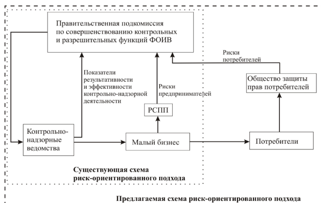
Рис. 1. Схема реализации риск-ориентированного подхода

водители привели к тому, что рыночным контролем качества продукции на сегодняшний момент не занимается никто [9].