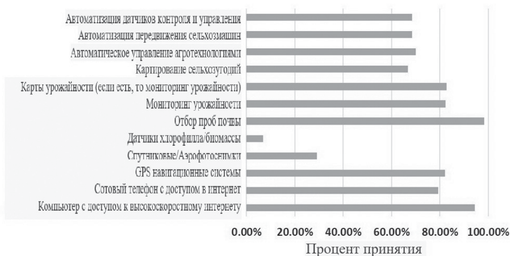
Рис. 1. Результаты опроса фермерских хозяйств о внедрении технологий точного земледелия [15]

Анализ, выполненный University of Nebraska-Lincoln, установил наблюдающийся в настоящий период интерес фермеров к технологиям прецизионного земледелия. В работе анализировались результаты анкетирования 126 участников выставок Nebraska Extension в 2015 г., результаты которого приводятся на рис. 1 [15].