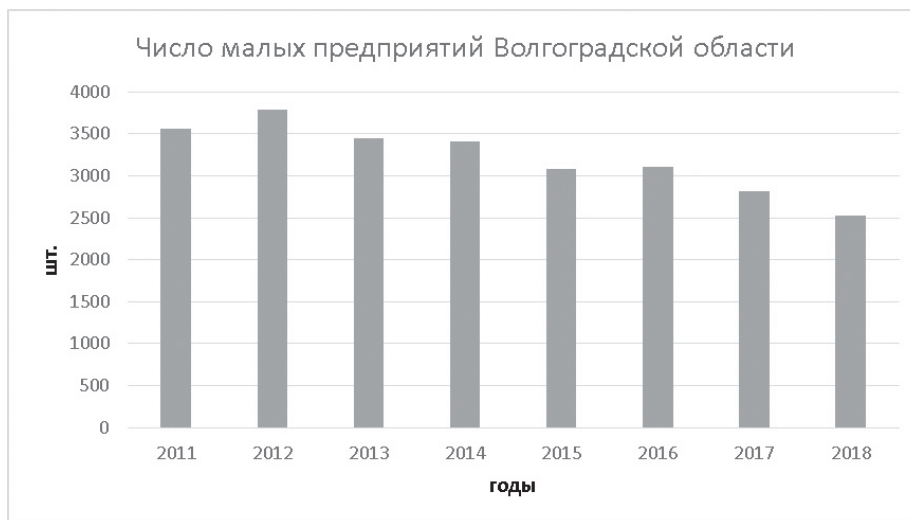
Рис. 1. Число малых предприятий Волгоградской области в 2011—2018 гг.

По состоянию на 1 января 2019 г. на учете в Статистическом регистре хозяйствующих субъектов по Волгоградской области состоят 43,4 тыс. организаций и 62,4 тыс. индивидуальных предпринимателей. Общее количество организаций по сравнению с началом 2017 г. сократилось на 7858 единиц (на 15,3 %). Число индивидуальных предпринимателей увеличилось на 1733 единицы (на 2,9 %) (табл. 1).