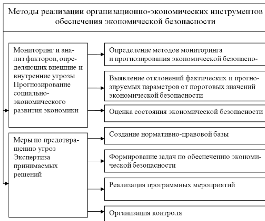
Рис. 3. Методы реализации организационно-экономических инструментов обеспечения экономической безопасности

Таким образом, государство должно осуществить комплекс мер, прежде всего по обеспечению экономического роста, что и будет гарантией экономической безопасности страны.