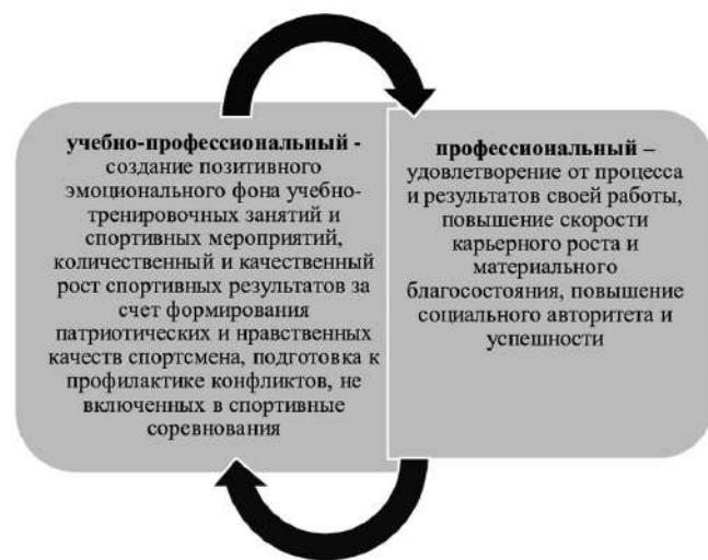
Рис. 3. Результаты учебного и учебно-профессионального наставничества в спорте