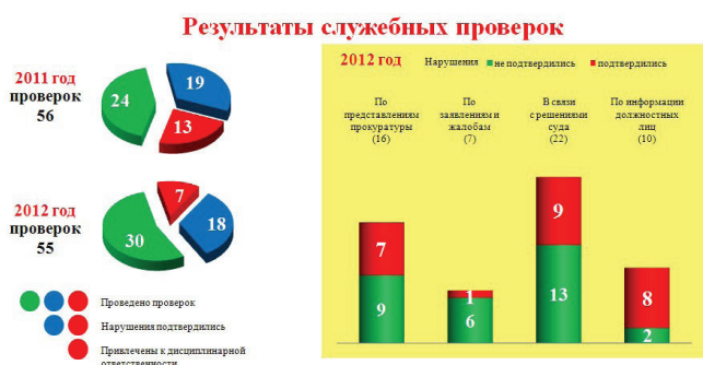
Рис. 5. Анализ служебных проверок, проведенных в Управлении Росреестра по Волгоградской области в 2011–2012 годах

Всего в 2012 году в Управлении Росреестра по Волгоградской области было проведено 55 служебных проверок, в ходе которых факты неисполнения или ненадлежащего исполнения гражданским служащим по его вине возложенных на него должностных обязанностей подтвердились в 25 случаях, к семи гражданским служащим были применены дисциплинарные взыскания (рис. 5).