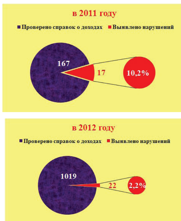
Рис. 6. Динамика снижения доли нарушений порядка составления и представления сведений о доходах

8. Обеспечение проверки соблюдения гражданами, замещавшими должности гражданской службы в Управлении Росреестра по Волгоградской области, ограничений при заключении ими после ухода с федеральной государственной службы трудового договора и (или) гражданско-правового договора в случаях, предусмотренных федеральными законами.