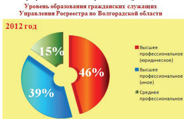
Рис. 4. Уровень образования гражданских служащих Управления Росреестра по Волгоградской области

Государственные гражданские служащие Управления Росреестра по Волгоградской области имеют непосредственный доступ к правовой информации. На каждом рабочем месте установлен программный продукт «Консультант-Плюс». Около половины гражданских служащих имеют высшее профессиональное образование по специальностям «Юриспруденция» и «Правоведение», около 40% – иное высшее профессиональное образование (рис. 4).