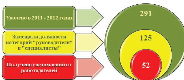
Рис. 7. Выполнение работодателями обязанности сообщать о приеме на работу уволенных с государственной службы граждан

В течение двух последних лет уволен из Управления Росреестра по Волгоградской области 291 гражданский служащий. Из количества уволившихся 125 замещали должности категорий «руководители» и «специалисты». По 52 бывшим федеральным государственным гражданским служащим поступила информация от работодателей об их трудоустройстве в иные организации (рис. 7).