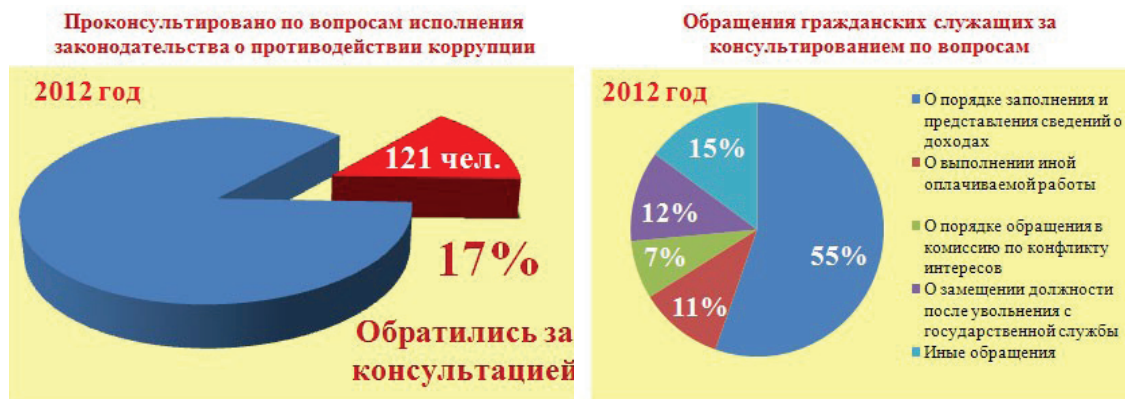
Рис. 3. Результаты работы по консультированию гражданских служащих и статистика их обращений

На интернет-сайте Управления ( http://www.to34.gosreestr.ru ) размещается справочная информация для гражданских служащих и граждан по правовым и иным вопросам гражданской службы и противодействия коррупции (Об Управлении Росреестра → Контакты → Справочная информация).