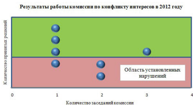
Рис. 2. Результаты работы комиссии по соблюдению требований к служебному поведению гражданских служащих и урегулированию конфликта интересов в 2012 году

4. Оказание гражданским служащим консультативной помощи по вопросам, связанным с применением на практике требований к служебному поведению и общих принципов служебного поведения государственных служащих [11].