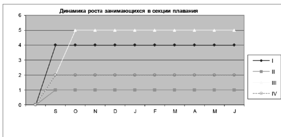
Рис. 1. График динамики роста количества занимающихся в секции плавания