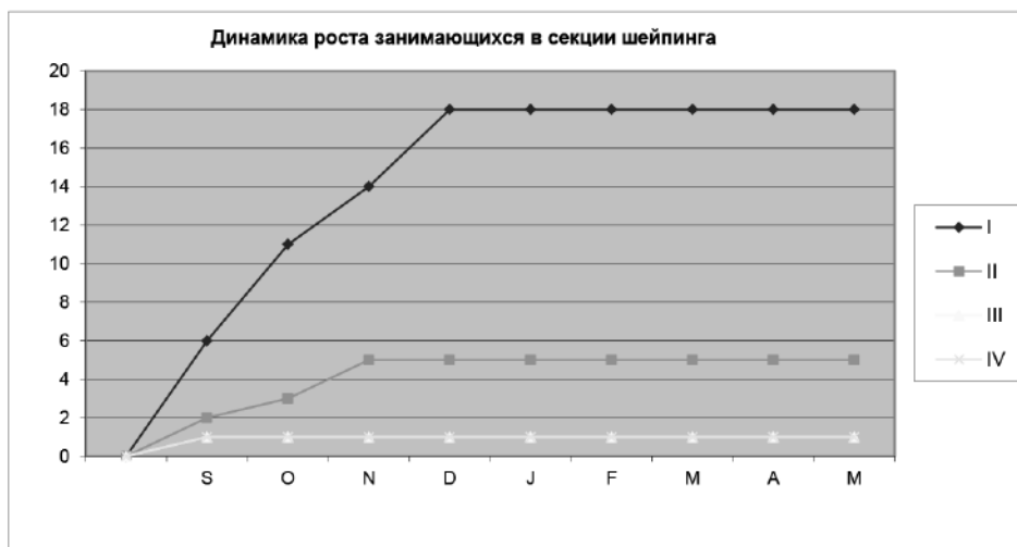
Рис. 3. График динамики роста количества занимающихся в секции шейпинга

спорта повышенный на общем фоне занимающихся. Положение стабильное, охвачены учащиеся 1—4-го курсов. Количество занимающихся в секции стабильно. Это говорит о том, что в секции нет текучести, люди заняты делом, любят волейбол, которому отдали свое предпочтение.