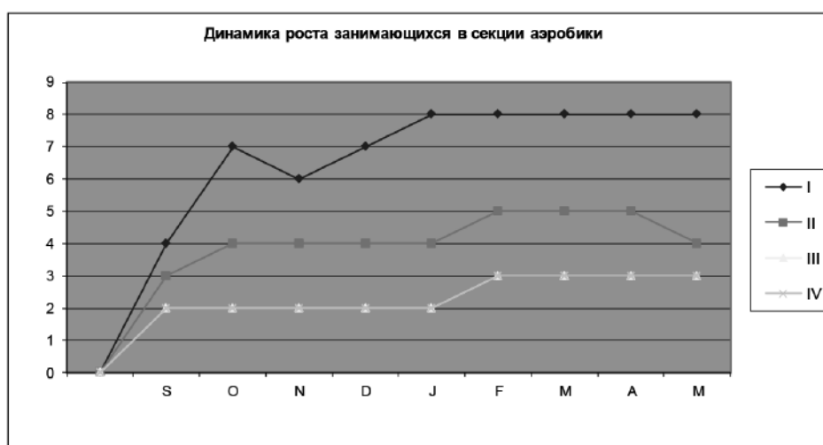
Рис. 2. График динамики роста количества занимающихся в секции аэробики

Коммерческая секция волейбола, работающая с начала года, объединила ребят, которые не попали в сборную университета. Это в основном юноши и девушки, не имеющие высших разрядов, но активно тренирующиеся и стремящиеся попасть в основную команду. Интерес к этому виду