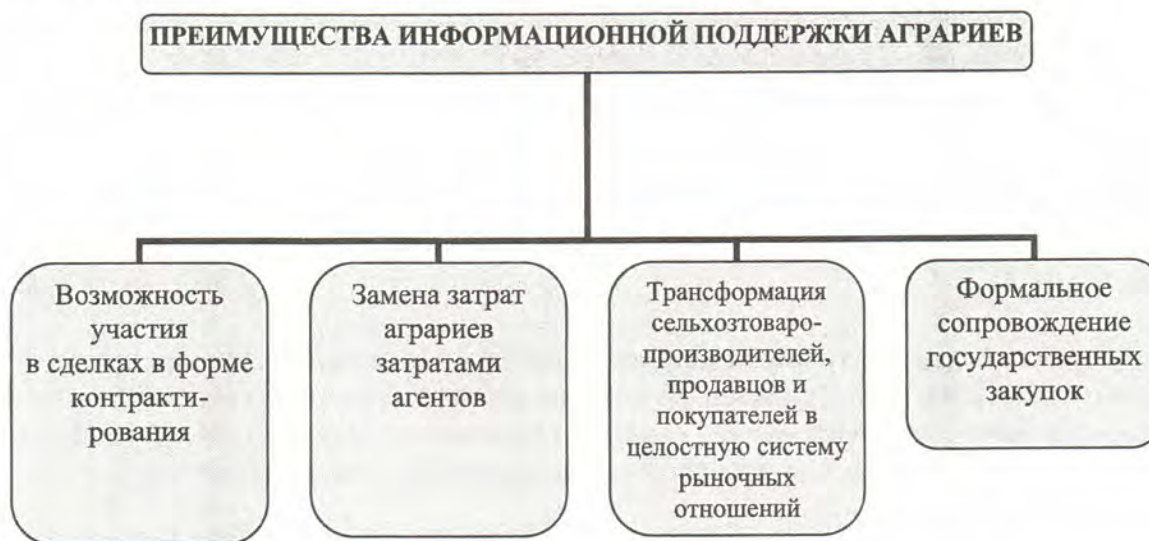
Рис. 1. Преимущества информационной поддержки аграриев

Таким образом, система информационной поддержки участников предпринимательских сделок становится действенным инструментом санкционированного воздействия на процесс обеспечения условий контрактации в сельском хозяйстве (рис. 1).