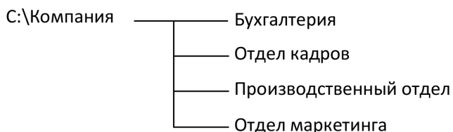
Рис. 1. Пример структуры хранения информации в компании

стоимость электронной информации по подразделениям организации: информации кадровой службы, бухгалтерии, производственного отдела, отдела маркетинга и пр. Хранение информации ведется в папках, соответствующих подразделениям компании (см. рис. 1).