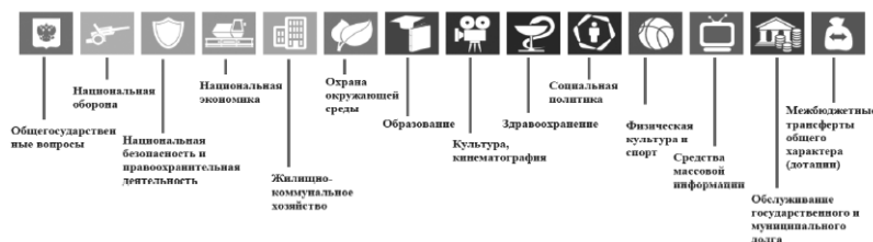
Рис. 1. Функциональная классификация расходов бюджетов Волгоградской области

Бюджетная политика в социальной сфере ориентирована на сохранение приоритетности в финансовом обеспечении обширного спектра задач в области образования, здравоохранения, социальной политики, культуры, физической культуры и спорта. В среднесрочной перспективе сохранится адресное оказание мер социальной поддержки граждан путем своевременного предоставления пособий, компенсаций, субсидий и других социальных выплат, предусмотренных действующим законодательством, продолжится поддержка материнства и детства, включая поддержку многодетных семей, детей-сирот, а также сохраняются другие меры социальной поддержки граждан. При этом меры социальной поддержки населению будут оказываться на основе адресности и критерия нуждаемости граждан. Приоритетом в финансировании социальной сферы в 2017 году остается реализация указов Президента России в части повышения средней заработной платы отдельным категориям работников.