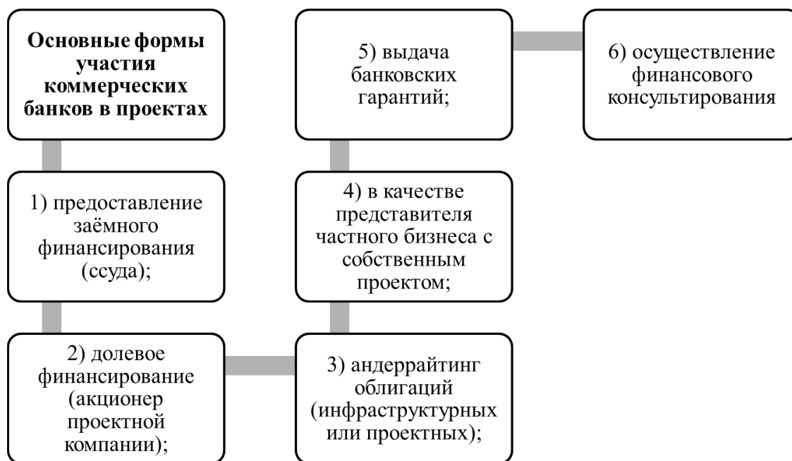
Рис. 1. Основные формы участия коммерческих банков в проектах. Источник [7]

Основные формы участия коммерческих банков в проектах представлены на рис. 1.