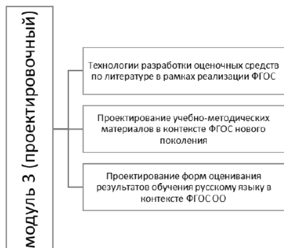
Рис. 2. Структура модуля курсов повышения квалификации

Каждый модуль представлен, в свою очередь, вариативным содержанием (рис. 2).