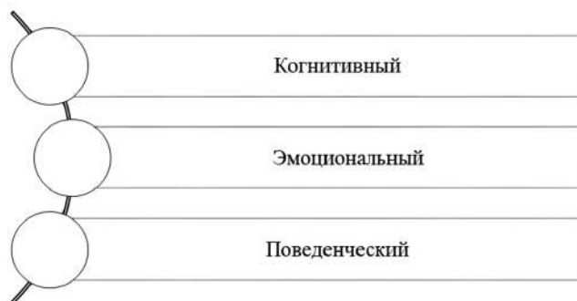
Рис. 1. Уровни интериоризации личности

В результате этого процесса человек начинает действовать не только под влиянием внешних факторов, но и исходя из внутренних мотиваций, ценностей. Речь идет о ключевом аспекте психологии и социологии, поскольку он помогает понять, каким именно образом формируется личность и как индивиды взаимодействуют с окружающим миром.