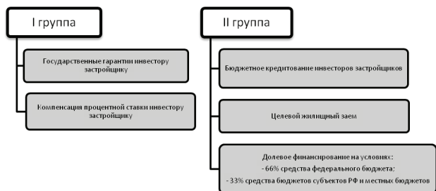
Рис. 2. Система бюджетных инструментов финансовой поддержки жилищного строительства

Каждое из этих направлений имеет свою весьма разветвленную структуру (рис. 2).