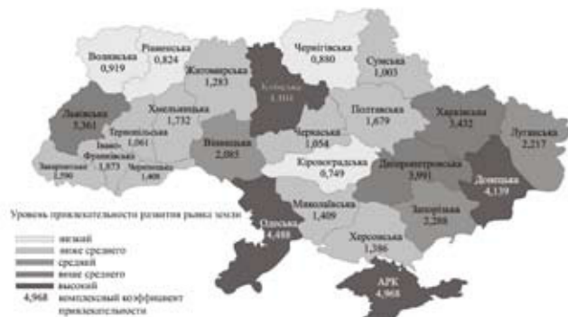
Рис. 2. Группировка регионов Украины по уровню привлекательности развития рынка земель несельскохозяйственного назначения

Аналогичное исследование может проводиться и в других сегментах земельных отношений: арендных, ипотечных, землеохранных и др. О достоверности результатов свидетельствует отображение переменными уравнения структуры функционального назначения проданных земель, реально сложившейся на рынке (это участки под застройку и коммерческое использование). На основе выделенных факторов сформирован комплексный коэффициент привлекательности для развития рынка земли, по уровню которого проведена рейтинговая оценка и типологизация регионов Украины (рис. 2).