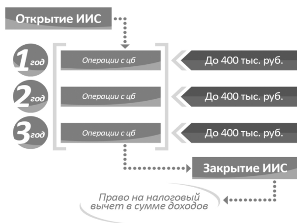
Рис. 2. Схема реализации инвестором налогового вычета по типу Б

Введение инвестиционных налоговых вычетов дополняет модель реформирования налогообложения физических лиц, предлагаемую рядом авторов, например У. В. Михайлик [4].