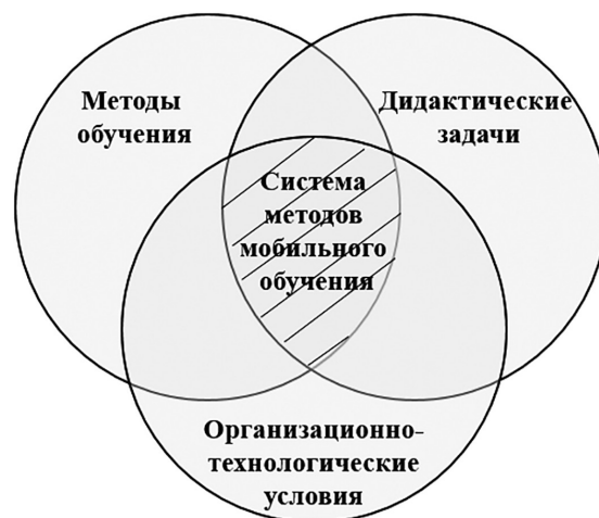
Рис. 1. Компоненты системы методов мобильного обучения

Основой для построения системы методов мобильного обучения выступают методы обучения, дидактические задачи и организационно-технологические условия (см. рис. 1).