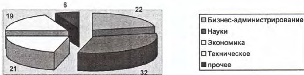
Диаграмма 3. Профиль образования студентов МВА в США, %

Важной отличительной особенностью поведения ведущих американских школ бизнеса на рынке образовательных услуг сегодня являются их активные действия по продвижению курса МВА для руководящего персонала компаний - Executive MBA. Эта программа обучения является новым продуктом на рынке образовательных услуг, отличающимся прежде всего своим более высоким научно-техническим и технологическим уровнем. Именно в силу более высокой технологии и качества обучения реализация такой программы под силу далеко не всем вузам. Эта программа кардинально отличается от традиционного МВА как по содержанию, так и по форме и методам обучения. Во-первых, стоимость обучения здесь настолько высока, что она сравнима с неплохим консалтинговым проектом по развитию бизнеса. Поэтому, компания, направляя своих перспективных сотрудников на такое обучение, справедливо ожидает того, что они наберутся новых идей и станут настоящими внутренними ускорителями развития фирмы. Подобные ожидания клиентов учитываются прежде всего при подборе преподавательского состава.