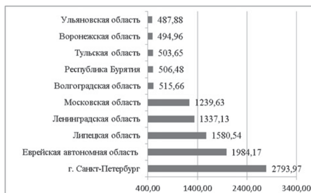
Рис. 1. Регионы с самой низкой и самой высокой величиной субсидий в расчете на 1 семью, тыс. руб.

о среднем значении расходов субсидий, выделяемых на одну семью, представлены на рис. 1.