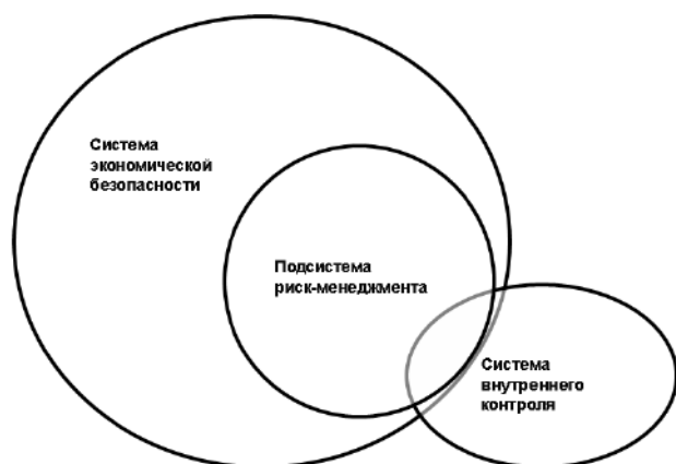
Рис. 2. Организационная структура системы экономической безопасности

Включение в список контролируемых угроз и рисков зависит от их существенности, определяемой как превышение величины риска над суммарными затратами на мониторинг и проведение мероприятий предотвращения угрозы. Эта сложная задача при наличии в хозяйствующем субъекте специализированного структурного подразделения риск-менеджмента относится к его компетенции (рис. 2).