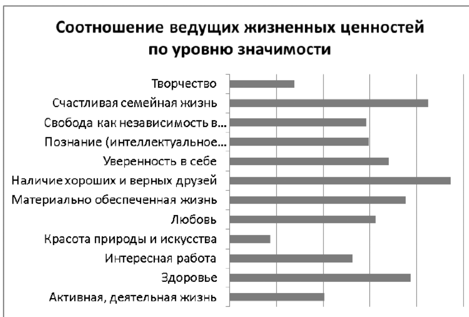
Рис. 1. Результаты исследования уровня значимости ценностей у студентов

Данные, полученные в результате исследования по методике УСЦД, показывают высокий уровень значимости для студентов таких ценностей, как счастливая семейная жизнь, наличие хороших и верных друзей, здоровье и материально обеспеченная жизнь (рис. 1).