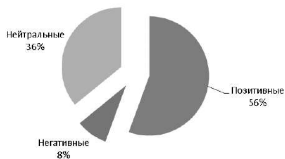
Рис. 4. Результаты опроса курсантов

Мы сопоставили наиболее популярные определения армии, указанные студентами и курсантами (табл.).