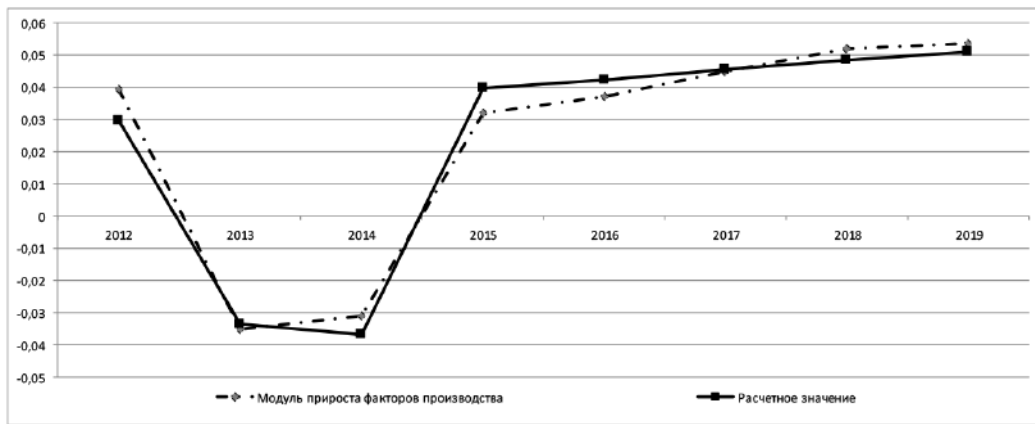
Рис. 1. Моделирование модуля прироста факторов производства Австрии