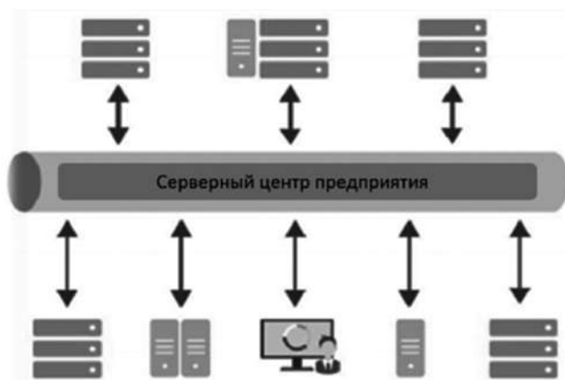
Рис. 3. Интеграция способом «Серверный центр» [15, с. 4885]

при некорректной работе центра может быть нарушена связь между участниками взаимодействия; проблемность наличия единственного канала для связи центра и участников из-за ограничения скорости работы центра; есть возможность снижения общей результативности взаимодействия (рис. 3).