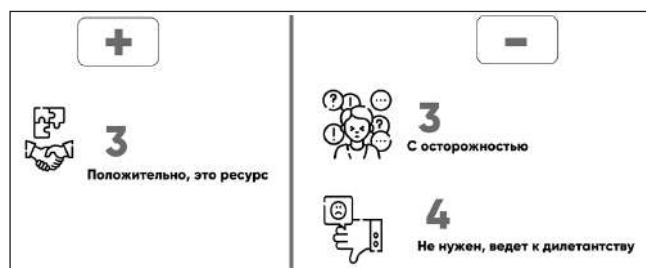
Рис. 3. Отношение респондентов к идее синтеза искусств как принципа, применение которого даст лучшие результаты обучения в художественной школе

Однако нельзя не брать во внимание наличие/отсутствие и качество такого опыта у художественных школ. И здесь возможны разные варианты, которые требуют более глубокого изучения при следующих исследованиях: полное отсутствие такого опыта и его боязнь, наличие негативного опыта, наличие неудачного и нерепрезентативного опыта и т. д. Нельзя не брать во внимание, что и сам термин синтез искусств может подразумевать разное наполнение и формы реализации. Так или иначе, само обнаружение лакун и зон, требующих изучения, в очередной раз ставит вопрос о нехватке исследований в области обучения изобразительным искусствам и критическом дефиците внимания к этой области на сегодняшний день.