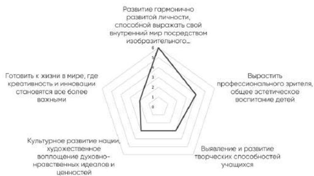
Рис. 2. Представления респондентов о том, какие педагогические задачи решает образование в области изобразительного искусства

О разночтении в понимании и наполнении термина «творческие способности» говорит и тот факт, что почти половина экспертов (40 %) считает именно их развитие главной задачей художественного образования. При этом «готовить к жизни в мире, где креативность и инновации становятся всё более важными» как педагогическую задачу выделило только 20 % экспертов (рис. 2). Очевидно, требуется ревизия терминологического аппарата педагогики искусства и уточнение понятий, разработка и утверждение общего для всех педагогов ИЗО глоссария и толкового словаря терминов.