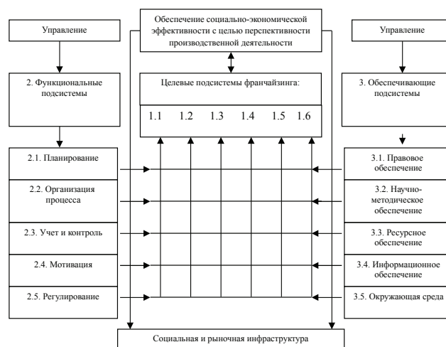
Рис. 3. Схема управления социально-экономической эффективностью франчайзинга (1.1 – повышение качества торговых услуг; 1.2 – реализация политики ресурсообеспеченности; 1.3 – расширение рынка сбыта (ассортимента); 1.4 – развитие организационно-технического уровня; 1.5 – социальное развитие коллектива; 1.6 – охрана окружающей среды)

Процесс обеспечения социально-экономической эффективности концессионных соглашений торгового предприятия мобилизует всю систему рыночных рычагов. Нормальное функционирование системы возможно только при условии четкого взаимодействия всех элементов целевых, функциональных и обеспечивающих подсистем. Для реализации любой подсистемы (например, повышения ассортимента) необходимо применение современных подходов и методов формирования структуры и содержания функциональных и обеспечивающих подсистем, создание условий для их развития. Система обеспечения уровня эффективности концессионных соглашений обусловлена уровнем потенциала торговых предприятий, его количественными и качественными параметрами и конкурентной средой. Таким образом, анализ взаимосвязей категорий социально-экономической эффективности показывает, что контрактные отношения на условиях франчайзинга являются внешней формой проявления социально-экономической эффективности и обусловлены качеством и положительной динамикой потенциала торгового предприятия и условиями рыночной конкуренции.