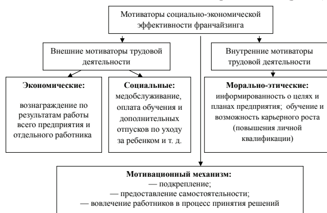
Рис. 4. Схема взаимосвязей мотиваторов социально-экономической эффективности франчайзинга [7]

Таким образом, предлагаемая методика управления концессионными соглашениями позволяет определить уровень социально-экономической эффективности франчайзинга и обосновать механизм мотивации его реализации (рис. 4).