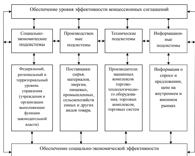
Рис. 2. Схема взаимосвязей эффективности концессионных соглашений

Обеспечение уровня эффективности концессионных соглашений в рамках системы контрактных отношений может быть рассмотрено на основе ее обусловленности развитием социально-экономических, производственных, технических и информационных подсистем, которые определяют особенности рыночных преимуществ и уровень торгово-технологического обеспечения. Такая система обеспечения эффективности на основе франчайзинга является сложной, открытой и состоит из следующих подсистем (рис. 2).