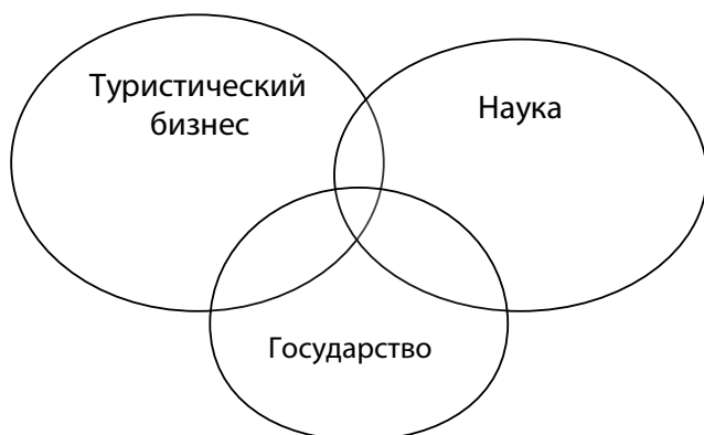
Рис. 1. Полноценный кластерный альянс в отрасли туризма

Для того чтобы туристический кластер развивался в будущем, он должен представлять современный инновационный кластер, а основой построения должно являться гармоничное взаимодействие науки (университетов), бизнеса и государства. Три данных сектора образуют кластер и гибридные сетевые организации. Полноценный кластерный альянс представлен на рис. 1.