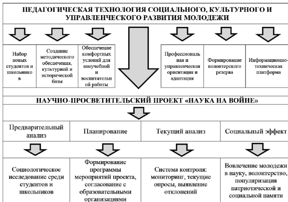
Рис. 2. Педагогическая технология социального, культурного и управленческого развития молодежи через волонтерский и научно-просветительский проект «Наука на войне»

По результатам исследования была сформирована педагогическая технология социального, культурного и управленческого развития молодежи (см. рис. 2).