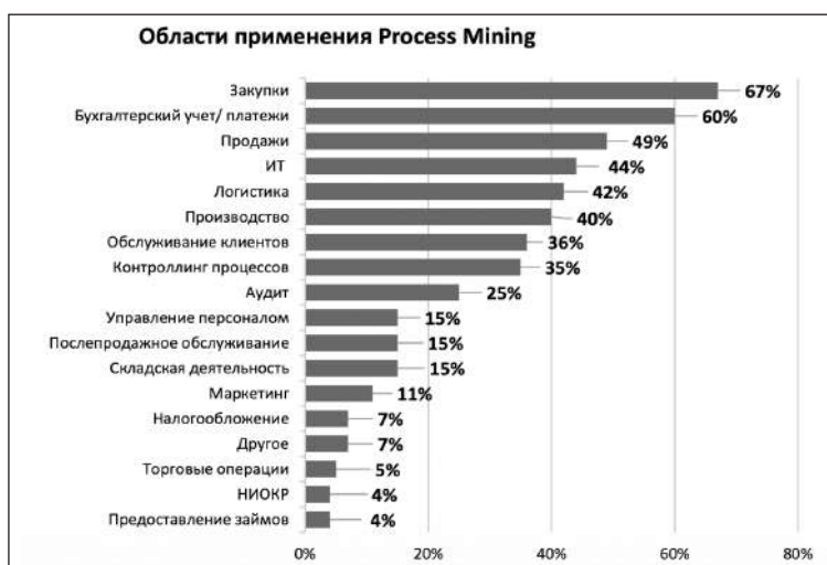
Рис. 1. Области применения Process Mining в корпорациях, % (сост. по: [14, с. 8])

Компанией «Делойт» было проведено исследование по использованию процессов автоматизации, таких как RPA и PM , в «традиционных корпорациях». На рис. 1 ниже представлен перечень бизнес-процессов, где цифровые сервисы наиболее востребованы и внедряются в структуру корпоративных финансов. Перспективными направлениями внедрения цифровых сервисов являются такие направления, как закупки (67 % респондентов), бухгалтерский учет и платежи (60 %), продажи (49 %), ИТ (44 %), логистика (42 %), производство (40 %), обслуживание клиентов (36 %), контроллинг процессов (35 %), аудит (25 %), управление персоналом (15 %), послепродажное обслуживание (15 %), складская деятельность (15 %), маркетинг (11 %), налогообложение (7 %), другое (7 %), торговые операции (5 %), НИОКР (4 %), предоставление займов (4 %).