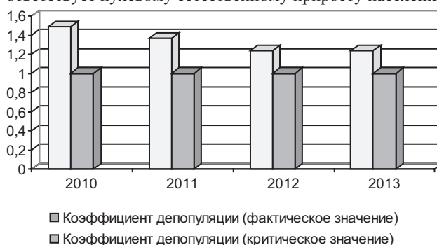
Рис. 3. Условный коэффициент депопуляции по Ульяновской области

Условный коэффициент депопуляции показывает отношение числа умерших к числу родившихся за определенный период. Предельное критическое значение — 1,0 (соответствует нулевому естественному приросту населения).