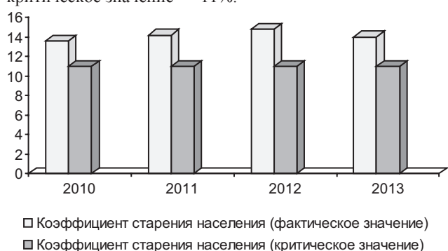
Рис. 1. Коэффициент старения населения по Ульяновской области, %

Коэффициент старения населения показывает долю лиц старше 65 лет в общей численности населения. Предельное критическое значение — 11%.