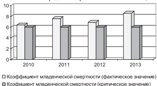
Рис. 4. Коэффициент младенческой смертности по Ульяновской области, %

Коэффициент младенческой смертности показывает число умерших детей в возрасте до 1 года на 1 тыс. родившихся живыми. Предельное критическое значение — 6,0%.