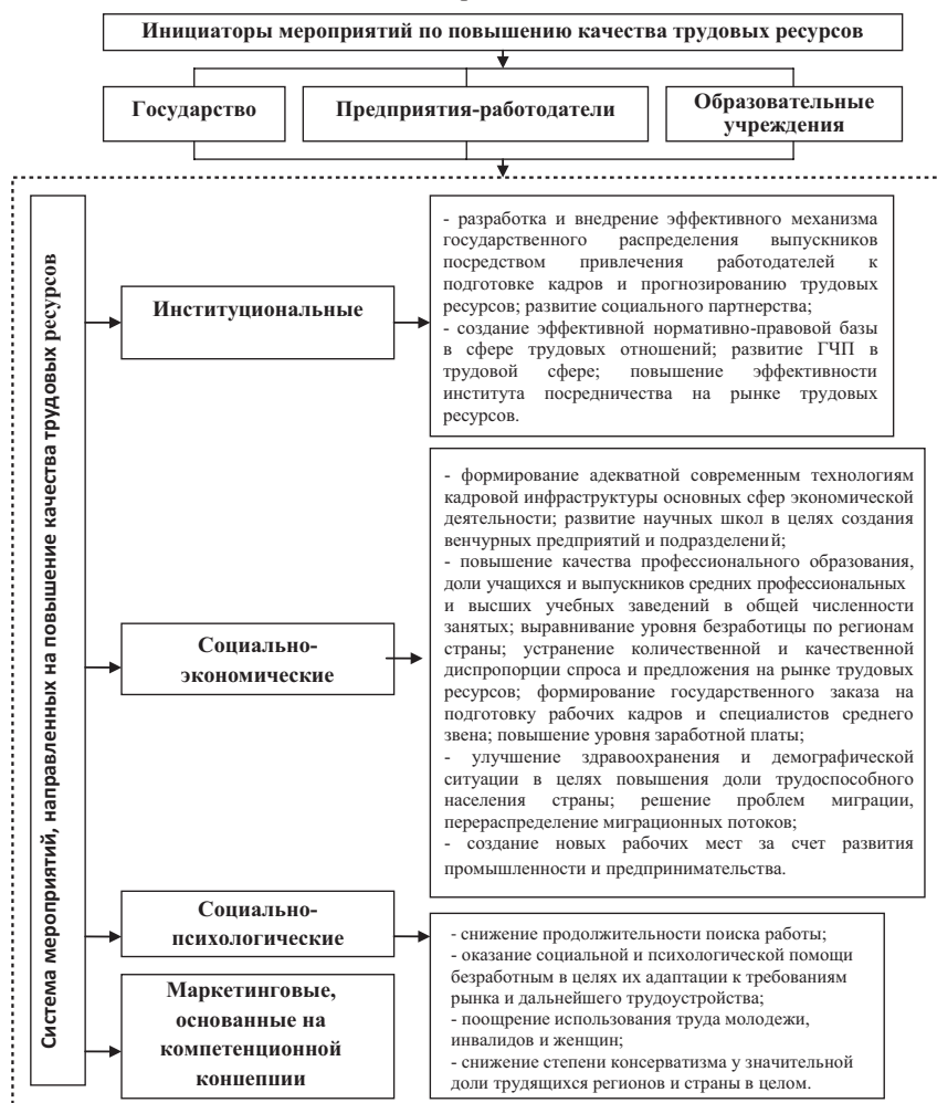
Рис. 2. Система мероприятий, направленных на повышение качественных характеристик трудовых ресурсов

Достаточно результативным направлением движения инвестиционных потоков, которые предназначены для подготовки специалистов, является «предприятие — учебное заведение», что обеспечивает сбалансированность спроса и предложения на рынке трудовых ресурсов (РТР) и уменьшает время окупаемости инвестиций в этот проект. Таким образом, с одной стороны, предприятие получает специалистов высокого уровня, адекватного рыночным условиям, с другой — будущему работнику дается гарантия наличия рабочего места и оплаты стоимости его рабочей силы.