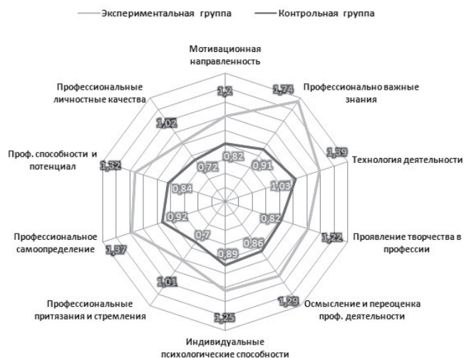
Рис. 2. Диаграмма роста показателей уровня профессионально важных компетенций и личностных качеств студентов

На диаграмме (рис. 2) приведены результаты исследования величины роста профессиональной компетентности (по всем ее показателям) как у студентов, погруженных в практико-ориентированную образовательную среду, так и у студентов, обучающихся в традиционной образовательной среде, организованной на основе знаниевой парадигмы.