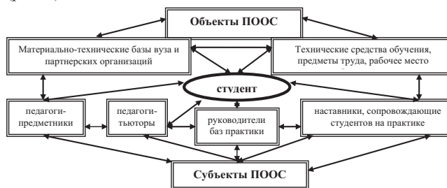
Рис. 1. Взаимодействие объектов и субъектов практико-ориентированной образовательной среды

Очевидно, что практико-ориентированная образовательная среда выступает как некое постоянно изменяющееся пространство, характеризующееся направленностью на самосовершенствование и саморазвитие всех участников, вступающих во взаимодействие, продвигающееся и развивающееся вместе со своими субъектами и объектами деятельности (рис. 1).