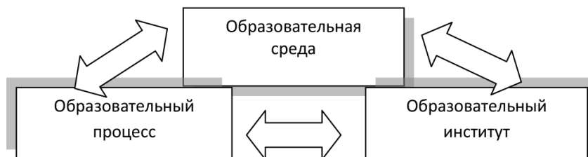
Рис. 1. Простейшая модель образовательного пространства

екции, а их взаимопересечение или взаимовлияние. Например, среда задается совокупностью образовательных институтов и образовательных процессов; образовательный институт нормативно определяет и организует содержание образовательной среды и образовательных процессов через детализацию требований к уровню предметной подготовки обучающихся. На образовательный процесс влияет тип института и содержание образовательной среды (рис. 1) [8].