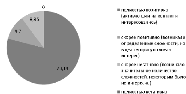
Рис. 2. Реакция детей на мероприятия, проводимые волонтерами

говорят о положительной реакции детей на проводимую с помощью социально-культурных мероприятий социальную реабилитацию.