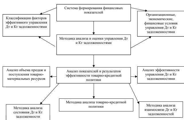
Рис. 2. Система комплексного анализа дебиторской и кредиторской задолженности

Резерв по сомнительным долгам может быть использован организацией лишь на покрытие убытков от безнадежных долгов, к которым можно отнести те долги перед налогоплательщиком, по которым истек срок исковой давности, а также те долги, по которым в соответствии с гражданским законодательством обязательство прекращено вследствие невозможности его исполнения.