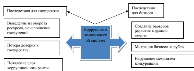
Рис. 1. Основные проявления отрицательных экстерналий коррупции для государства и бизнеса (сост. автором)

Основные проявления отрицательных экстерналий коррупции для государства и бизнеса отражены на рис. 1.