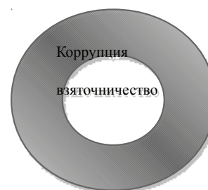
Рис. 2. Соотношение коррупции и взяточничества

Специалисты отмечают, что многообразие коррупционных проявлений нередко сводится к взяточничеству. Это некорректно, поскольку это лишь одна из ее форм и ею все коррупционные проявления не охватываются (см. рис. 2).