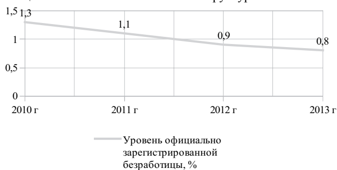
Рис. 2. Численность официально зарегистрированных безработных граждан Ростовской области на конец 2013 года (составлено автором по данным [6])

Рис. 1 наглядно свидетельствует о том, что по итогам первого полноценного года в рамках ВТО экономика региона продемонстрировала явную тенденцию к увеличению экономического роста. Важным свидетельством тенденций роста региональной экономики является увеличение инвестиций в основной капитал бизнес-структур.