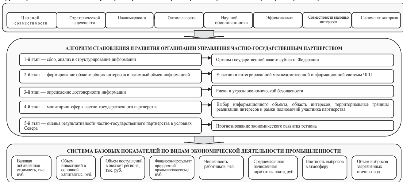
Рис. 1. Организационный механизм управления частно-государственным партнерством в условиях Севера Базовые показатели эффективного управления частно-государственным партнерством

информации межведомственной информационной системы других регионов значительно ускорит процесс контроля финансово-хозяйственной деятельности участников частно-государственного партнерства разных регионов.