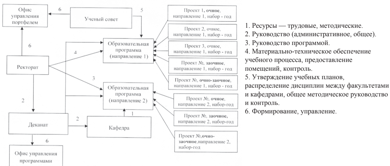
Рис. 2. Офис управления образовательной программой

Следует учитывать, что цели программы могут не совпадать с целями отдельных проектов и связаны со стратегическими целями вуза. Выполнение отдельного проекта в составе программы может не приводить к ощутимым результатам, в то время как выполнение всей программы может давать существенные стратегические результаты для вуза.