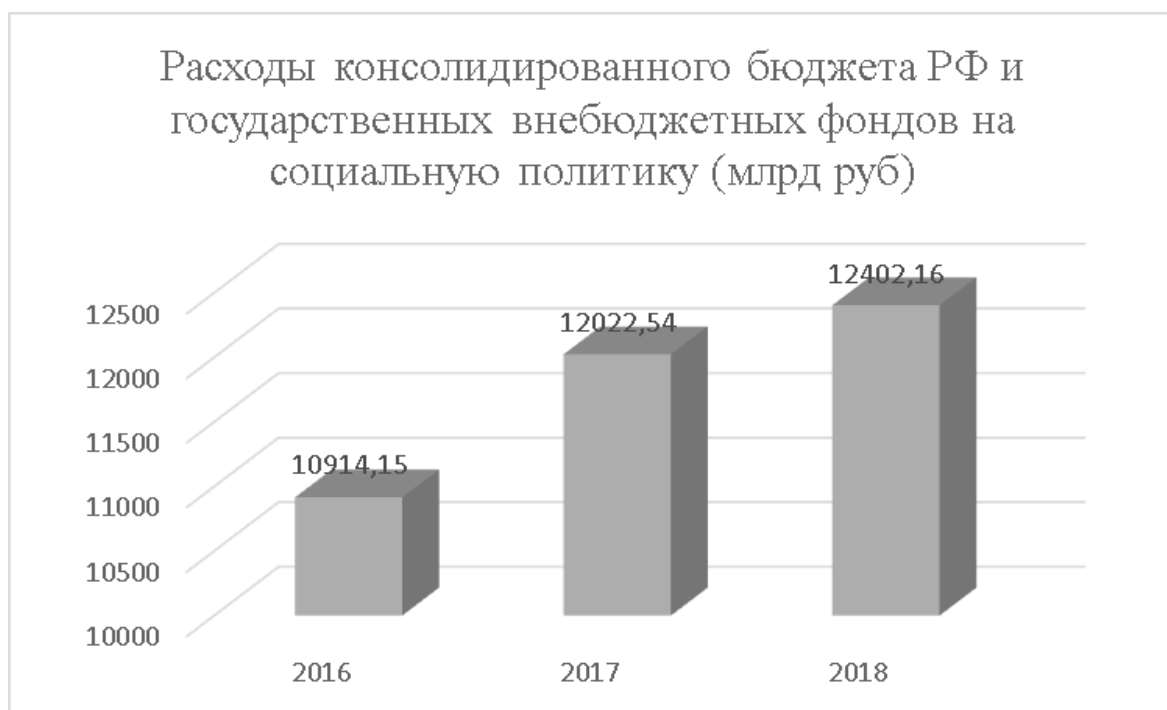
Рис. 1. Динамика расходов консолидированного бюджета РФ и государственных внебюджетных фондов на социальную политику (составлено автором по официальным данным Федерального казначейства) [4]

Стоит обратить внимание на то, что в общем объеме расходов консолидированного бюджета РФ и государственных внебюджетных фондов на социальную политику доля расходов на пенсионное обеспечение составляет почти 67 %, тогда как расходы на социальное обеспечение и социальное обслуживание населения составляют значительно меньшую долю — 30 % (рис. 2).