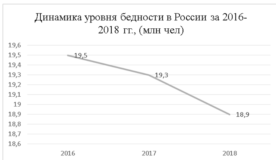
Рис. 3. Динамика уровня бедности в России за 2016—2018 гг., млн человек (составлено автором по официальным данным Росстата) [5]

19,3 млн человек, а за период январь — сентябрь 2018 г. — 19,6 млн человек; по предварительным данным за 2018 г. показатель составляет 18,9 млн человек (рис. 3).