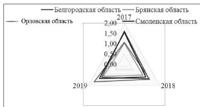
Рис. 2. Сравнительный анализ уровня финансовой безопасности регионов за 2017—2019 гг. (рассчитано авторами)

На основании проведенного анализа можно отметить, что наибольший уровень устойчивости и безопасности финансовой системы присущ Орловской области.