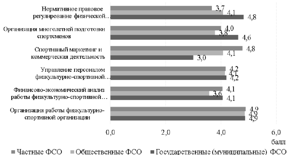
Рис. 1. Степень влияния профессиональных знаний, умений и навыков на эффективность управленческой деятельности руководителей ФСО, n = 48 чел.

Полученные результаты сопоставимы с выводами исследований в США [10] и Китае [11]. Обобщение практического опыта на основании анализа 21 программы из пяти физкультурно-спортивных и пяти экономических вузов (семь регионов России) показало, что, несмотря на разницу в направлениях 49.03.01 «Физическая культура» и 38.03.02 «Менеджмент», компетенции, устанавливаемые образовательными организациями самостоятельно, имеют схожий характер — способность осуществлять управление комплексной деятельностью физкультурно-спортивной организации и (или) ее струк-