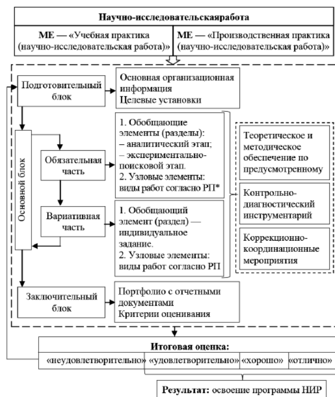
Рис. 2. Модель обобщенной структуры содержания научно-исследовательской работы магистрантов (*РП — рабочая программа)

С целью полноценного выполнения предусмотренных заданий целесообразно структурировать содержание практик и выделить обобщающие, узловые и основные элементы в модульной единице. Причем каждый основной элемент должен подкрепляться теоретическим материалом и методическим обеспечением для самостоятельного выполнения предусмотренных заданий. Контрольно-диагностический инструментарий позволяет магистранту осуществить самоанализ полноты и своевременности выполненных работ, а педагогу осуществить контрольно-координационные мероприятия в рамках консультаций («онлайн» или «офлайн» режимах, а при возможности и желании обучающихся в очном формате).