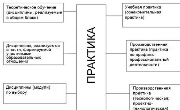
Рис. 2. Взаимосвязь теоретической и практической подготовки будущих финансовых менеджеров

Таким образом, основные аспекты при проектировании ООП «Финансовый менеджмент» были учтены. Схема взаимосвязи отдельных компонентов практики, связанной с профессиональной деятельностью и теоретической подготовки, представлены на рис. 2.